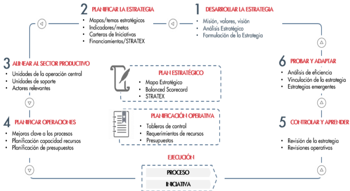
Figura 8: Ciclo de Kaplan y Norton

Fuente: Modelo de Robert S. Kaplan y David P. Norton, en el libro “The Execution Premium” integrando la estrategia con las operaciones.