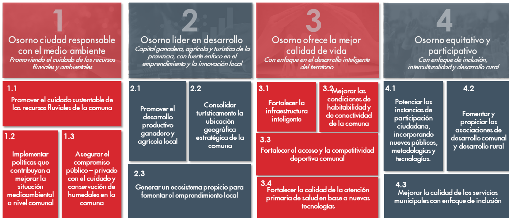
Figura 5: Mapa de objetivos estratégicos

Los objetivos estratégicos se identificaron a partir de cada uno de los desafíos y ámbitos estratégico, tal como se muestra en la siguiente figura: