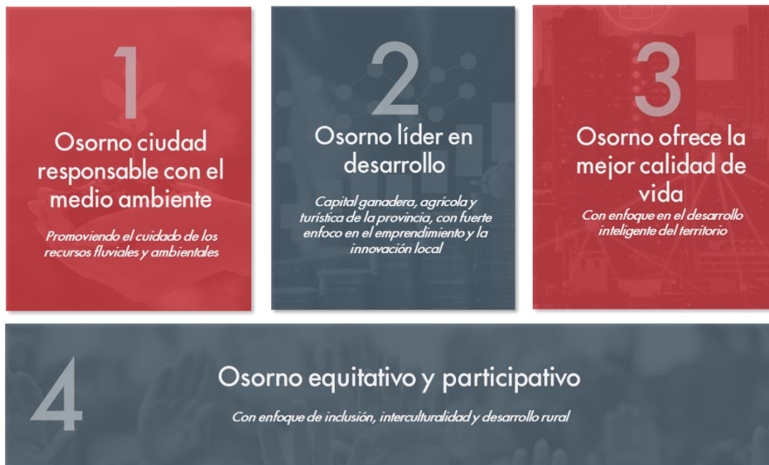
Figura 4: Áreas prioritarias de desarrollo

Basándose en el análisis realizado, se identificaron cuatro grandes áreas de desarrollo, las que van enfocadas directamente a la Imagen – Objetivo que se propone para la comuna en el desarrollo de estas en los próximos cuatro años. Estas cuatro líneas de acción están pensadas para la consecución del desarrollo de la comuna, los que se presentan en la figura a continuación.