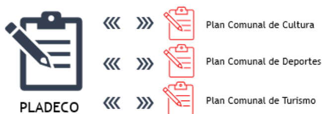
Figura 7: Alineamiento de planes comunal y PLADECO

En relación con lo anterior, la consultoría realizada a la municipalidad de Osorno cuenta con un PLADECO que se utiliza como base para la construcción de los planes comunales de Cultura, Deportes y Turismo. Es decir, cada plan comunal realizado esta alineado con el PLADECO de la comuna y, por tanto, no es correcto mencionar a un plan comunal específico como un PLADECO en particular. La figura 1 a continuación presenta de manera gráfica lo establecido previamente: