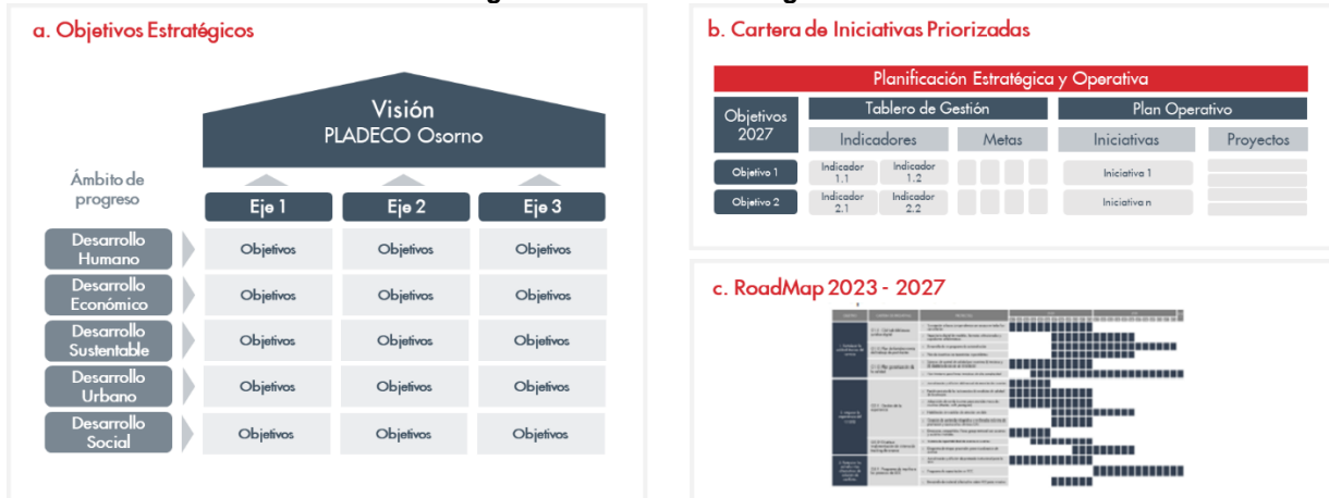
Figura 2: Marco metodológico