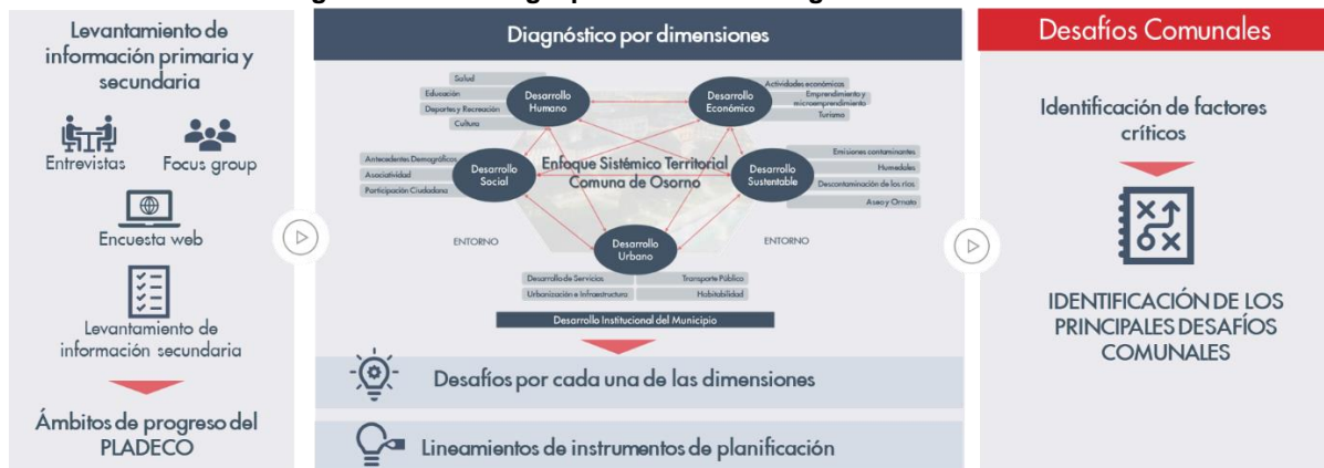
Figura 1: Metodología para abordar el diagnóstico comunal

A partir de la información primaria se recabaron percepciones, lineamientos y ámbitos de trabajo en materia en cada una de las dimensiones de análisis sobre las cuales se formula el diagnóstico de la comuna, además de información secundaria mediante la recolección de datos mediante la revisión de fuentes oficiales a nivel nacional e internacional, además de antecedentes y estadística propia del municipio.