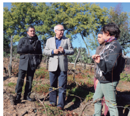
Visita a viñas de esta localidad.

Las autoridades comunales osorninas visitaron las viñas “Magenta”, “Ñipanto” y “Piedras del Encanto”, las que incluso han sido premiadas con medallas de oro y plata en diversos concursos internacionales por la calidad de su producción.