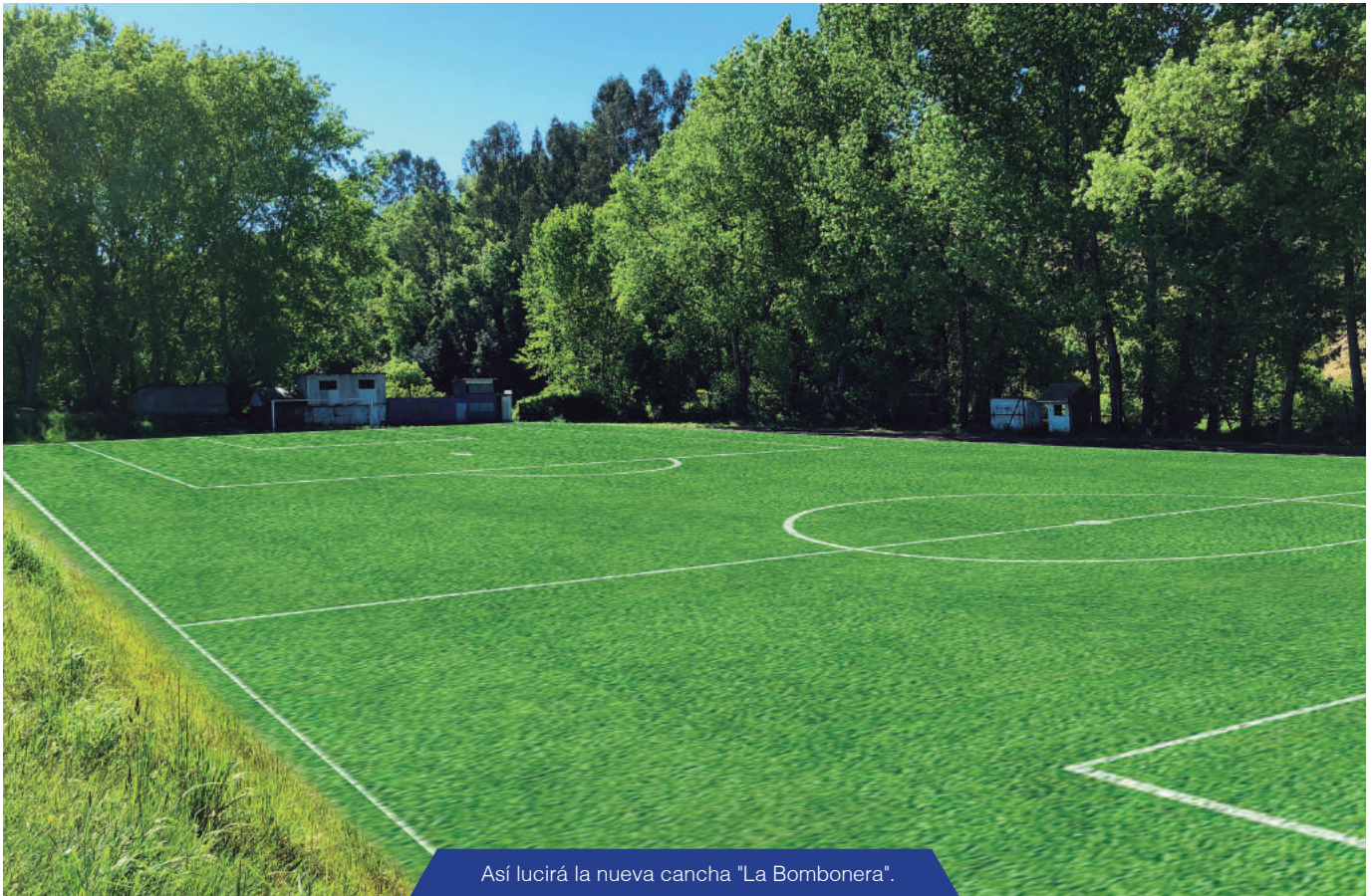
Así lucirá la nueva cancha "La Bombonera".