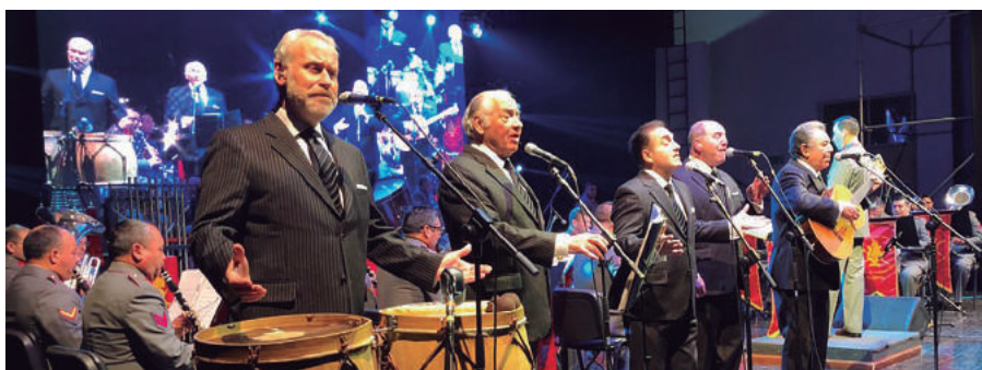
Actuación de "Los Cuatro Cuartos".

El evento fue producido por el municipio de Osorno, junto al Destacamento de Montaña N°9 Arauco, trabajo que responde a la alianza cultural que ambas instituciones suscribieron a favor del crecimiento cultural de la ciudadanía.