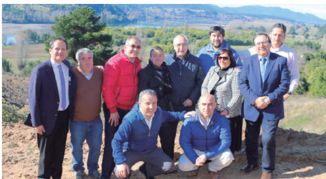
Autoridades de Osorno y Ránquil, en pleno Valle del Itata.