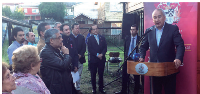
Entrega de nueva sede Población Huertos Obreros.