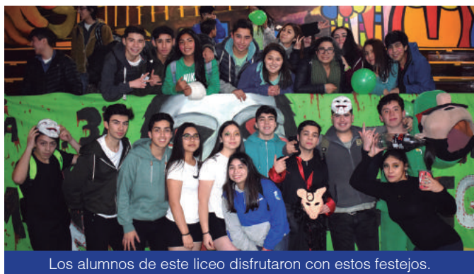
Los alumnos de este liceo disfrutaron con estos festejos.

1.040 Alumnos Tiene este recinto educativo