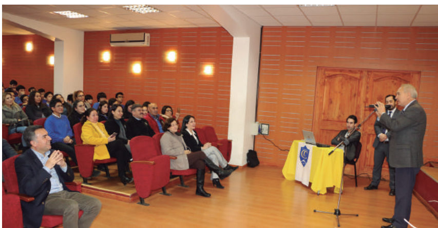
Alcalde lideró reunión de difusión de este proyecto a la comunidad educativa.