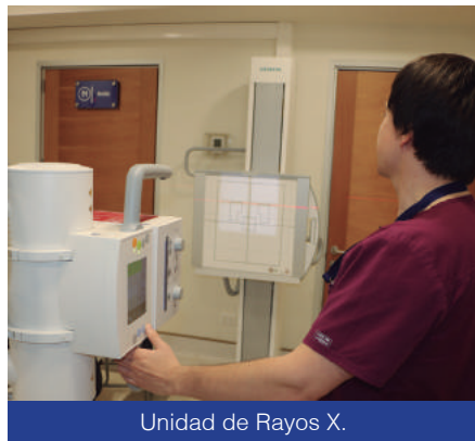
Unidad de Rayos X.

El Centro de Referencia y Diagnóstico Médico atiende de lunes a viernes, de 08:00 a 17:00 horas y cualquier duda o consulta sobre los servicios que brinda se pueden efectuar al teléfono 642327238.