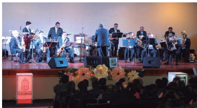
La Banda Municipal de Osorno deleitó a la comunidad de Ránquil.