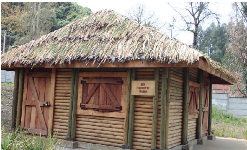
En el Parque IV Centenario se encuentra ubicado este hito histórico.