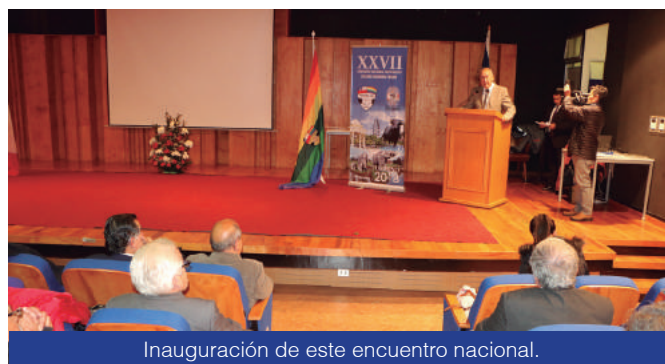
Inauguración de este encuentro nacional.