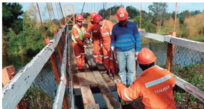
Alianza entre municipio y Vialidad permitió reparar esta estructura.