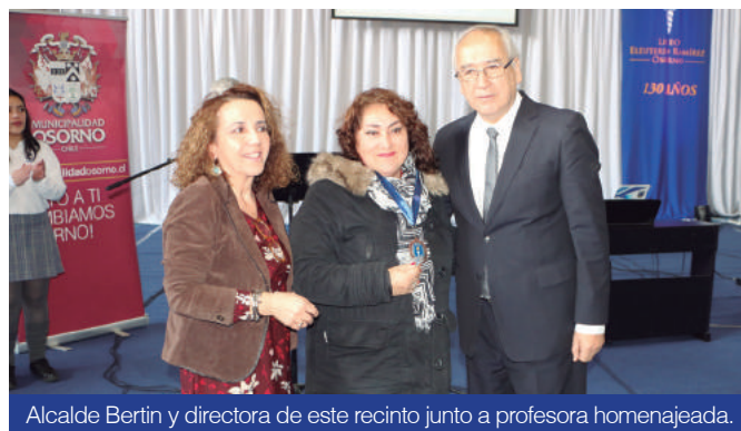
Alcalde Bertin y directora de este recinto junto a profesora homenajeada.