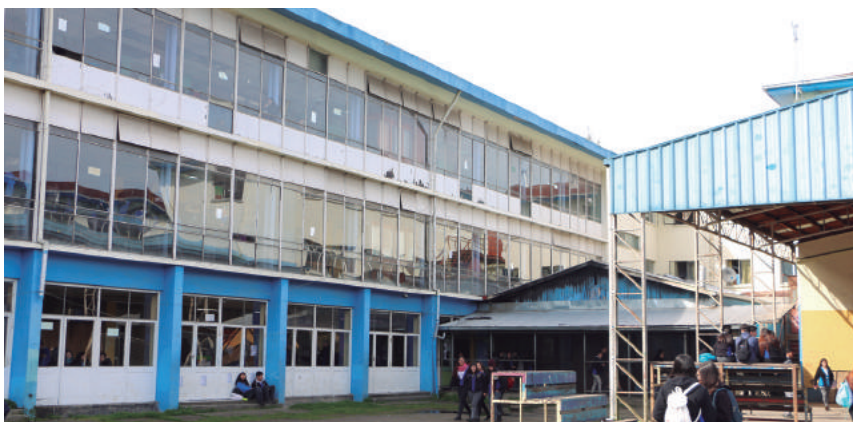
Más de 1.200 alumnos serán beneficiados con esta obra.