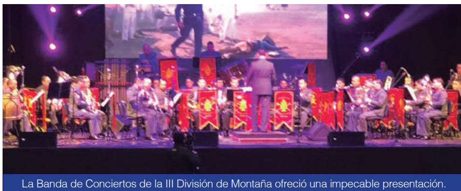
La Banda de Conciertos de la III División de Montaña ofreció una impecable presentación.