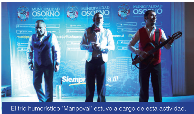
El trio humorístico "Manpoval" estuvo a cargo de esta actividad.

Fue tal el éxito de esta actividad que, atendiendo a la masiva participación, el próximo año se va a repetir la experiencia, aumentando los cupos, ya que el interés de la comunidad organizada por participar de esta escuela fue mayor la proyectada.