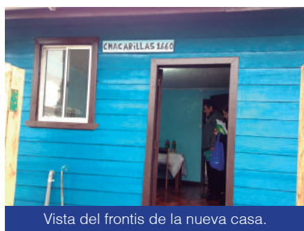
Vista del frontis de la nueva casa.