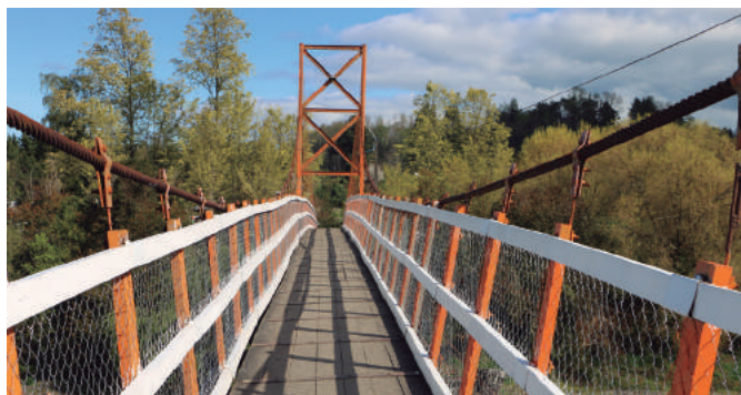
Vista de la mejorada pasarela peatonal de Cancura.