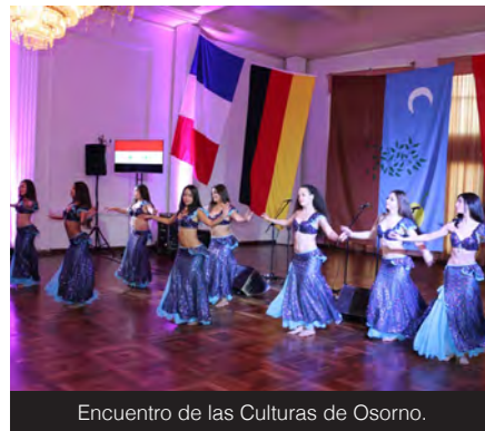
Encuentro de las Culturas de Osorno.