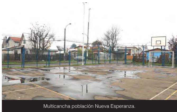
Multicancha población Nueva Esperanza.

Sin duda, buenas noticias para el desarrollo de estos barrios, a lo que también hay que añadir las futuras multicanchas en Plaza Venezuela y Villa Parque Nacional, gracias a la adjudicación de recursos por parte de la municipalidad del Fondo Regional de Iniciativa Local (Fril), el Gobierno Regional de Los Lagos.