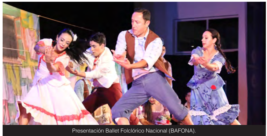
Presentación Ballet Folclórico Nacional (BAFONA).

el brasileño Fabricio; la "La Fiesta de las Culturas", con la participación de las colonias locales, y tantas otras actividades, que reunieron siempre la capacidad máxima de asistentes a cada uno de los recintos convocados.