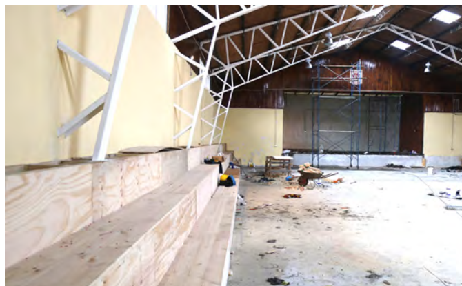
Vista a obras de mejoramiento del gimnasio de la Escuela Suiza.