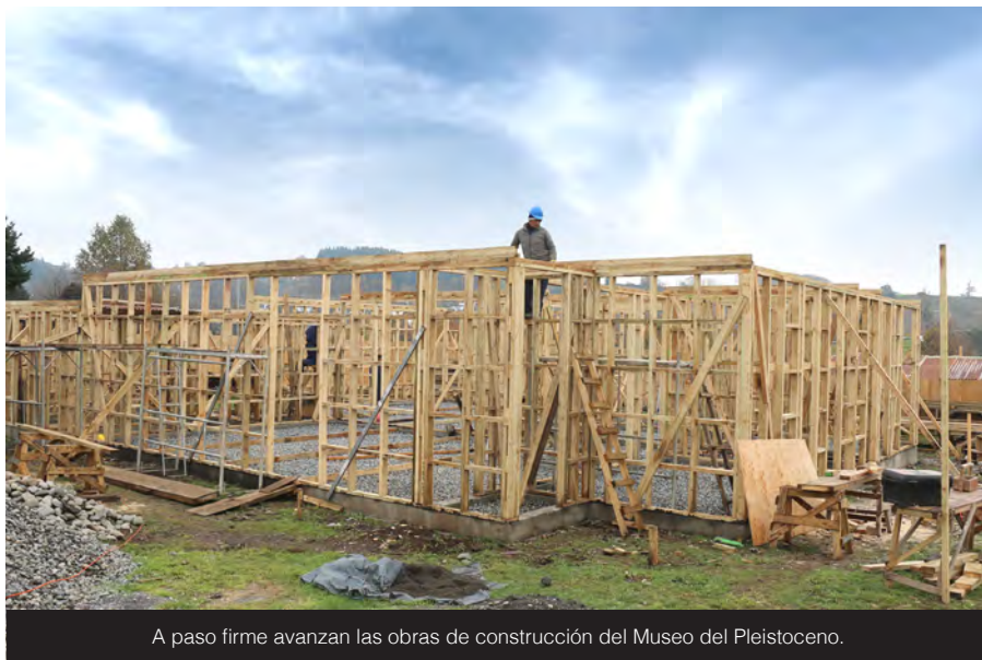
A paso firme avanzan las obras de construcción del Museo del Pleistoceno.

Cabe destacar que las empresas a cargo de la ejecución de los proyectos del Museo del Pleistoceno y la Feria Gastronómica y Artesanal Itinerante son PSP Proyectos y Construcciones Limitada y la Constructora A y M Peldoza Limitada, respectivamente.