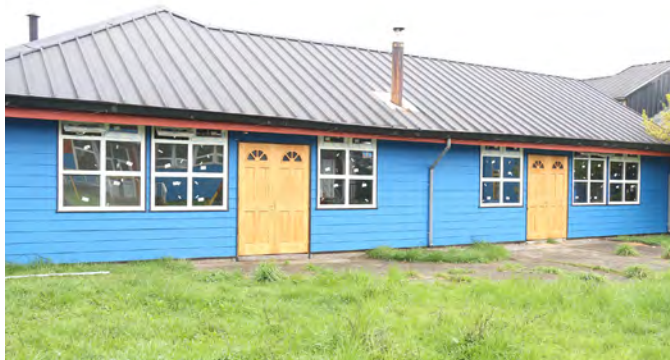
Pintura exterior en Internado de Escuela Ana Aichele.

Algunos de los proyectos más destacados que se ejecutan gracias a estos recursos son el mejoramiento estructural de la Escuela Especial Ana Aichele y la conservación del gimnasio e infraestructura de la Escuela Suiza, en Ovejería, obras que permitirán que sus alumnos asistan a clases en las mejores condiciones posibles.