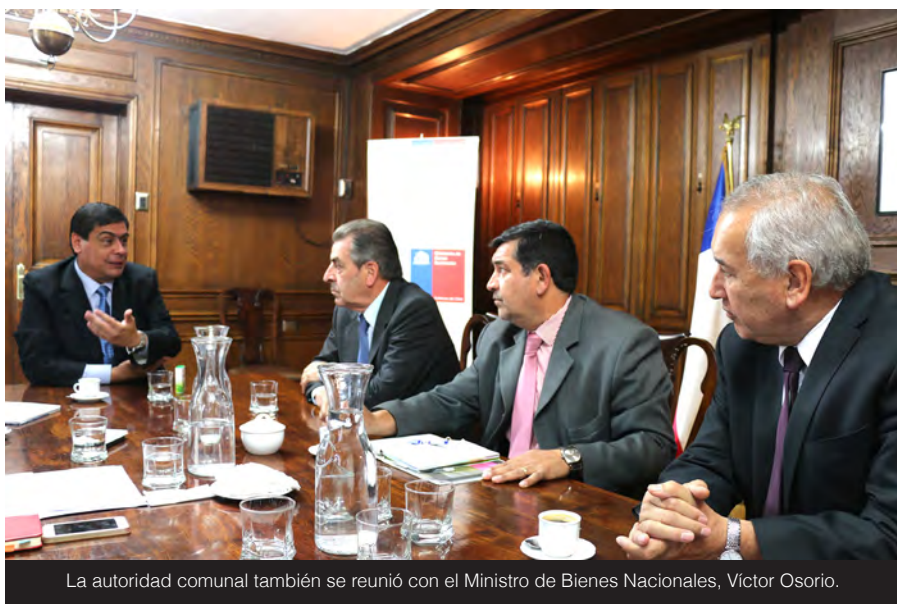
La autoridad comunal también se reunió con el Ministro de Bienes Nacionales, Víctor Osorio.

En esta reunión y en todos los encuentros que sostuvo el alcalde Jaime Bertin en Santiago, con diferentes ministerios, estuvo acompañado del ex Presidente de la República, Eduardo Frei, quien señaló que "mi compromiso con Osorno es permanente y por ello acompañe a su alcalde en esta serie de reuniones, donde el balance es positivo, ya que obtuvimos respuesta positiva a lo planteado, cuyo objetivo no es otro que ver concretadas grandes obras, en beneficio de esta ciudad y su gente".