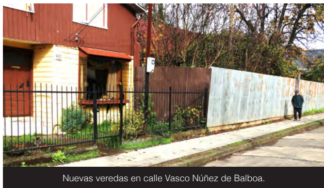
Nuevas veredas en calle Vasco Núñez de Balboa.