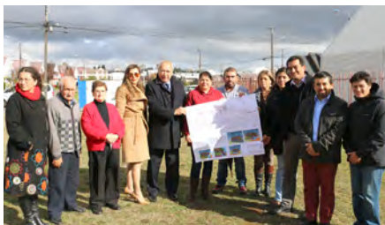
Vecinos de Villa Jardín del Alto con alcalde de Osorno.