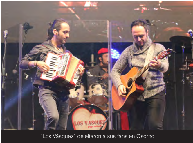
"Los Vásquez" deleitaron a sus fans en Osorno.