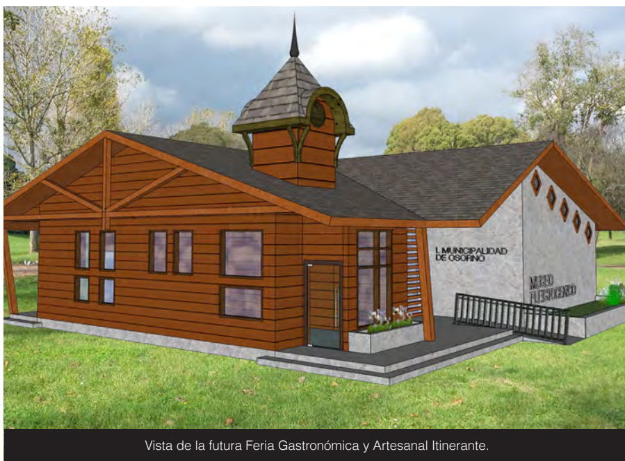
Vista de la futura Feria Gastronómica y Artesanal Itinerante.