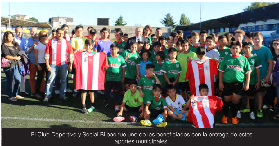
El Club Deportivo y Social Bilbao fue uno de los beneficiados con la entrega de estos aportes municipales.

a los $500 millones, con el objetivo de permitir el desarrollo del deporte, en todas sus disciplinas, en la comuna.