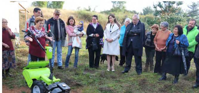
Entrega Motocultivador en sector de Huillinco.

A lo anterior se suma lo que fue la entrega de semillas de papa que, en esta oportunidad, favoreció a 250 familias, de diferentes sectores rurales. En concreto, cada beneficiado recibió 1 saco con esta ayuda, que permitirá que estos vecinos obtengan, en el futuro, un producto de gran calidad, ya sea para consumo familiar o bien para la venta posterior en diferentes ferias libres de la comuna.