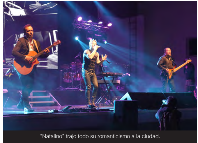
"Natalino" trajo todo su romanticismo a la ciudad.