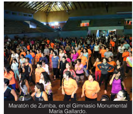
Maratón de Zumba, en el Gimnasio Monumental María Gallardo.