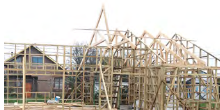
Construcción Sala Multiuso de población Pedro Aguirre Cerda.