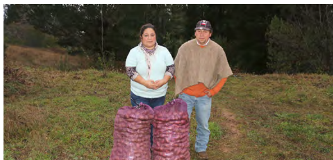
Vecinos agradecieron entrega de semillas de papa.